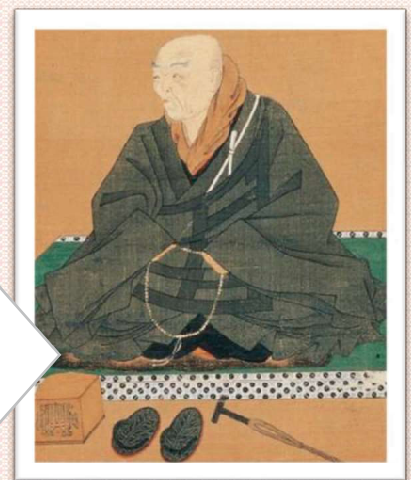
地図・写真／本願寺公式サイト